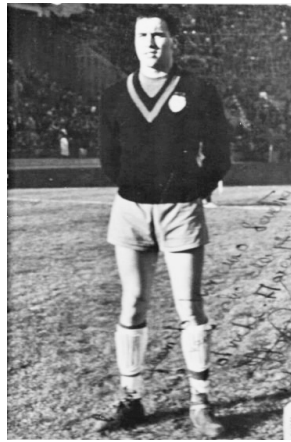
Con el Valencia en 1ª