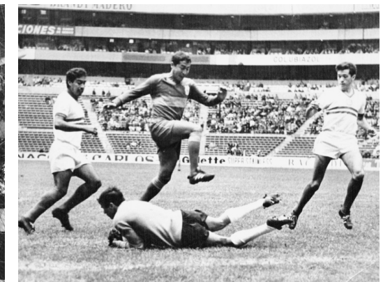
Parada de Florentino