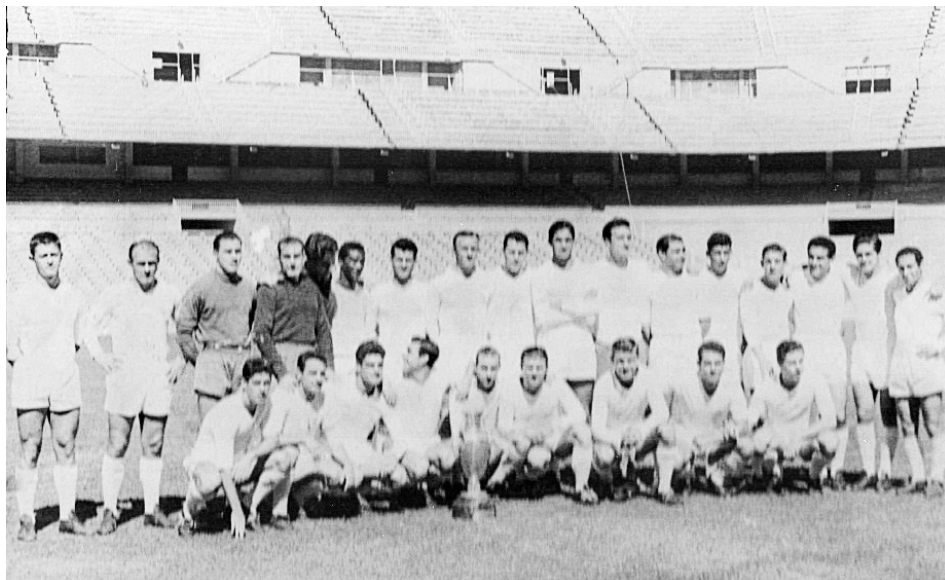
Real Madrid 1959-60