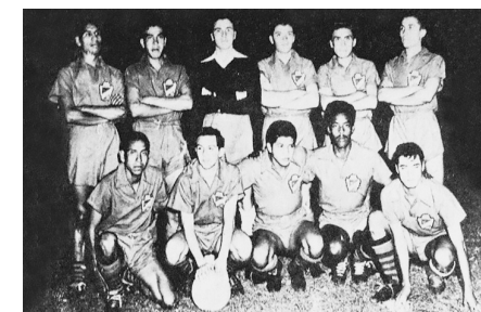
Irapuato F.C. 1952-53